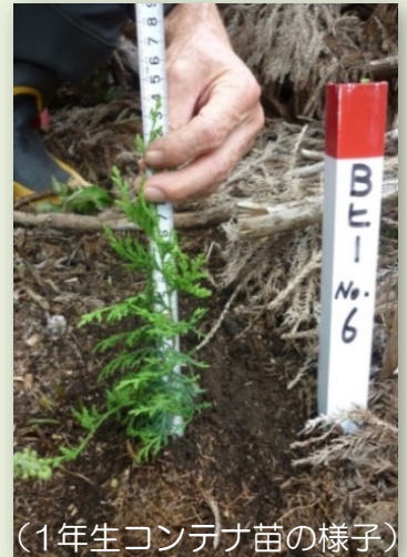
(1年生コンテナ苗の様子)