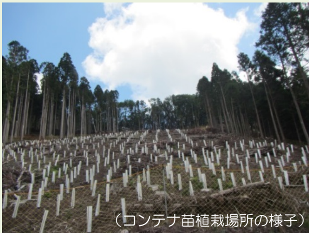
(コンテナ苗植栽場所の様子)