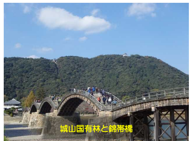
城山国有林と錦帯橋