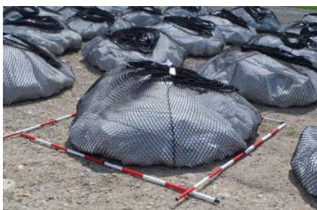
【約1.5m×1.5mの石入袋を作製】

雨水を分散して地表面の侵食を防止し、緑化の環境を整える「袋型筋工」を50個設置。