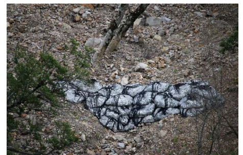
【石入袋を筋状に設置】