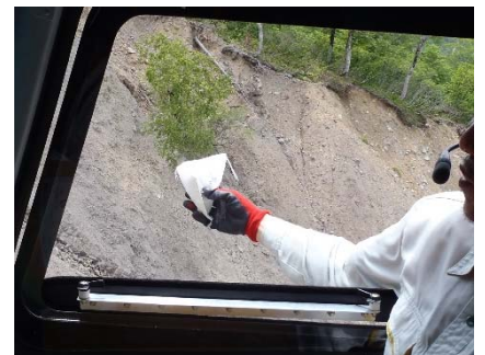
【施工箇所（袋型石詰土留め工の上部）】