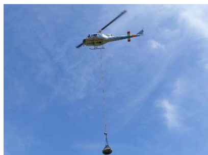
【ヘリによる施工状況】