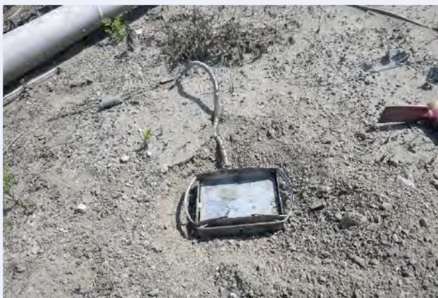
⑦ 穴に踏み板を置く