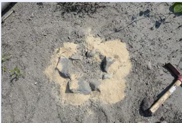
⑪石の周囲に餌をまく (完成) (写真は米ぬかを使用)