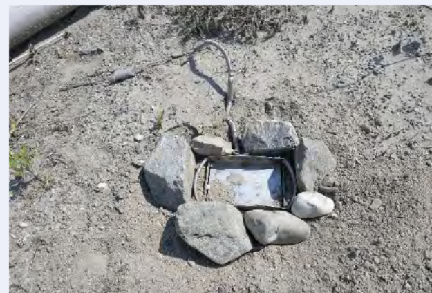
⑧ 踏み板周辺に石を置く