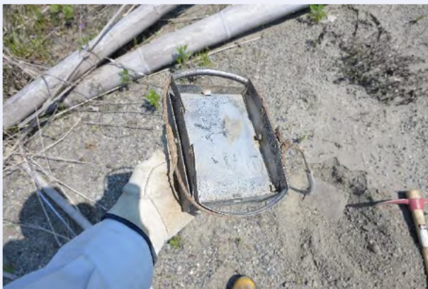
⑤ 踏み板にワイヤーをセット