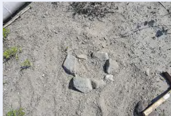
⑩バネと踏み板を隠す