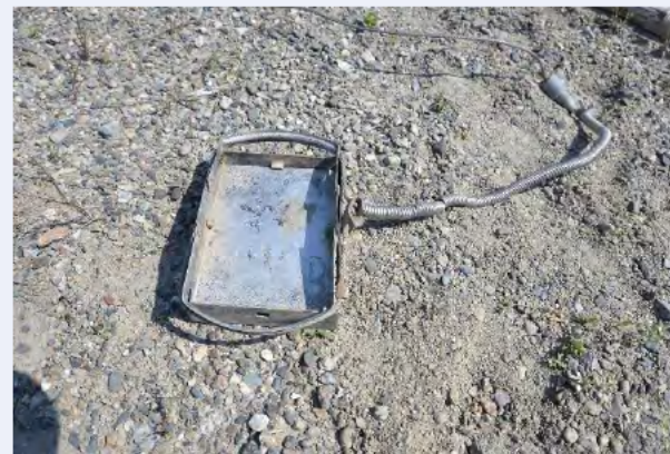
⑥ バネを圧縮し固定