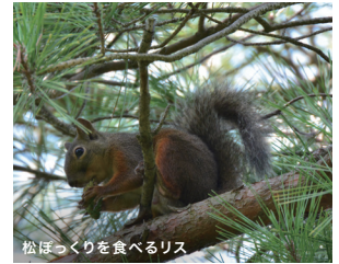
松ぼっくりを食べるリス

箕面の森は、温かな大阪湾と、冬季には冷たい季節風、複雑な地形や地質の影響を受けて、シダ類を含んだおよそ1,100種の植物が確認されています。3,000種を超える昆虫が生息するといわれており、数多くの野鳥、哺乳動物、両生は虫類等が生息する豊かな生態系が育まれています。東京の高尾、京都の貴船と並んで、日本三大昆虫生息地と言われている他、ニホンザルの生息地は天然記念物になっています。