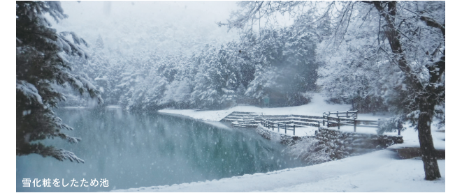
雪化粧をしたため池

温暖な気候であり、スギ、ヒノキを主体とする人工林とアカマツやコナラを主体とする天然林とが、ほぼ同割合で混じっています。