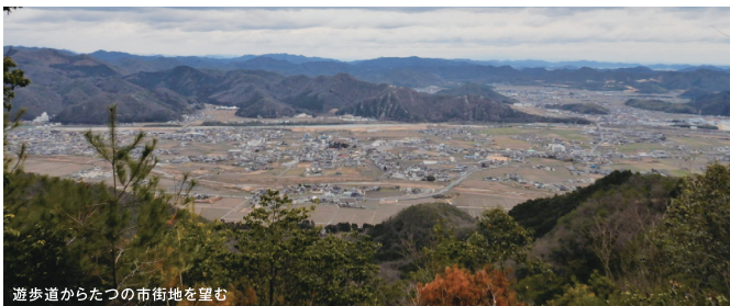
遊歩道からたつの市街地を望む

たつの市の中心市街地から北西約5kmのところを位置し、全体として高低差約400mというなだらかな丘陵となっています。