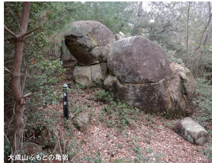
大成山ふもとの亀岩

この地域は、古くから天然の要害として知られた地であり、7世紀には大和朝廷により砦が築かれました。野外スポーツ地域の北東端部には奈良時代及び室町時代に築かれた山城である「城山城」の遺構が残っています。また、「城山城」の北西の野外スポーツ地域隣接地には、創建から2000年以上経過している井関三神社の奥宮が建立されています。