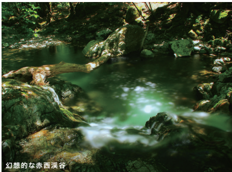
幻想的な赤西渓谷

鳥取県境の宍粟(しそ)市北部の標高480～880mの山間部に位置し、林道沿いは緩傾斜となっていますが、標高が高くなるにつれ急傾斜となっています。また、赤西渓谷は、水源の森百選やひょうごの森百選に選ばれており、宍粟市の水源として地域に恵みをもたらしています。