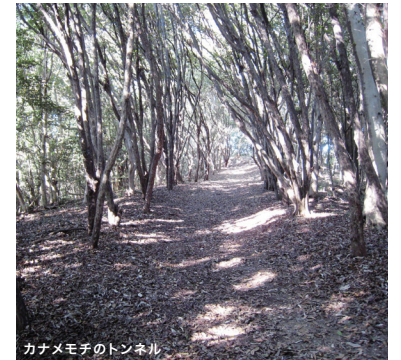
カナメモチのトンネル

操山は、岡山市街地の中心部にありながら、豊かな自然と数多くの古墳や中世城跡等の歴史にふれることのできる市民の憩いのスポットとなっています。また、最寄り駅である岡山電気軌道「東山駅」から徒歩約12分で歩道入口の奥市公園グラウンドにアクセス可能で、岡山後楽園や岡山城も徒歩30分以内と気軽に観光できる便利な位置にあります。