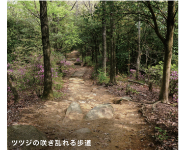
ツツジの咲き乱れる歩道

岡山県は、温暖な瀬戸内の気候で日照時間は年間約2,000時間と長く、年間降水量は1,100mm程度と全国的に見て非常に少ないので、「晴れの国おかやま」がキャッチフレーズとなっており、年間を通じて過ごしやすい気候です。林内は、カン・ナラ・クスギ等の混交林に加え、防火樹として植栽されたカナメモチが生育しています。また、ルリビタキやジョウビタキ、コゲラ等の鳥獣が息息するほか、昆虫はルリタテハ、ツバメジミ、ハンミョウ等を見ることができます。