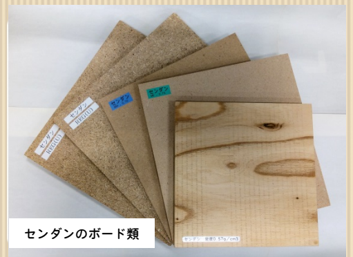
センダンのボード類