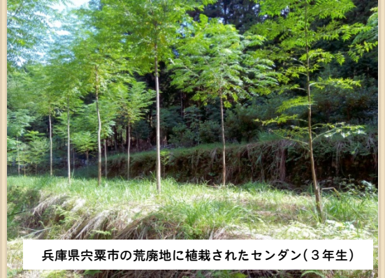
兵庫県中央市の荒廃地に植栽されたセンダン(3年生)

近年、在来種を活用した早生樹植林が話題となっています。特に植栽後20年以内に伐採・利用可能な広葉樹センダンは、家具利用だけでなく高品質の合板や木質ボードなどの工業原料としても有望です。さらに増加を続ける荒廃農地は、センダンの植栽に適した条件の土壌であり、耕作放棄地の対策としても有望です。センダンなどの早生樹を活用した研究を紹介し、里と里山の未来像を考えたいと思います。また、センダンを活用した試作品の展示や、さまざまな樹種を使った木琴、カホンなどの楽器体験ができる展示も計画しています。