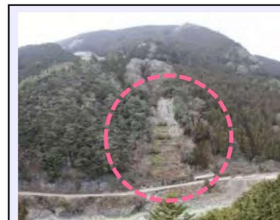
堂平工区(被災直後) ・地すべり兆候の規 3.00ha ・対策：アンカー工 (令和3年度工事完了・移管済)