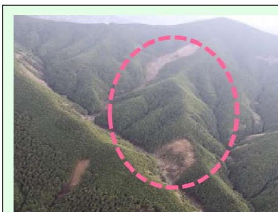
栃尾(桑谷)工区(被災直後) ・崩壊規模 1.5ha ・対策：谷止工及び山腹工 (令和3年度工事完了)