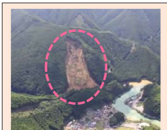
坪内工区(被災直後) ・崩壊規模 3.65ha ・対策：床固工及び山腹工