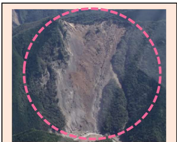
赤谷工区 (被災直後) ・崩壊規模 24.86ha ・対策：山腹工及び土留工