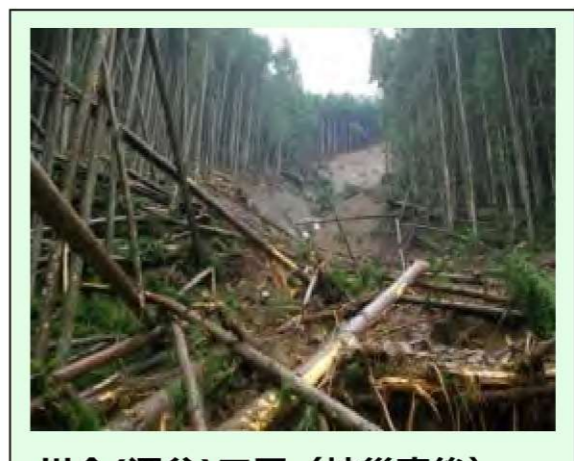
川合(深谷)工区 (被災直後) ・崩壊規模 0.54ha ・対策：山腹工 (平成25年度工事完了)