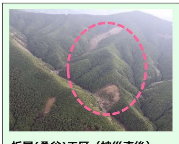
栃尾(桑谷)工区 (被災直後) ・崩壊規模 1.5ha ・対策：谷止工及び山腹工 (令和3年度工事完了)