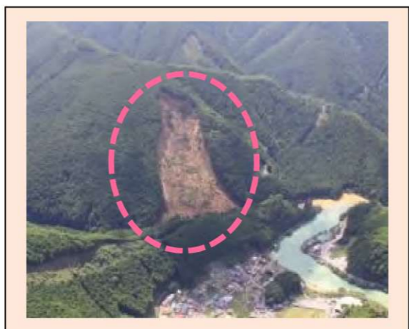
坪内工区 (被災直後) ・崩壊規模 3.65ha ・対策：床固工及び山腹工