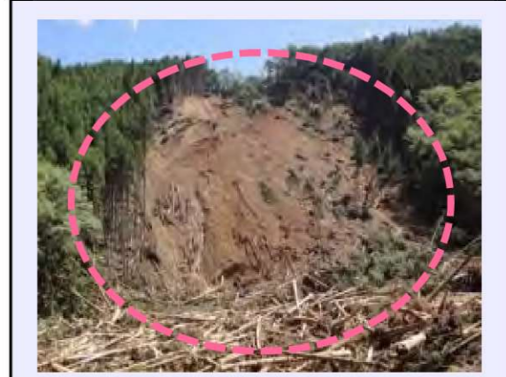
檜股工区 (被災直後) ・崩壊規模 1.56ha ・対策：谷止工及び山腹工 (令和3年度工事完了・移管済)