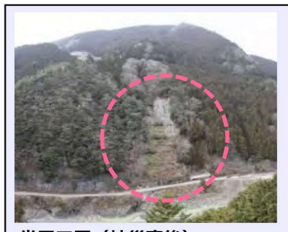
堂平工区 (被災直後) ・地すべり兆候の規 3.00ha ・対策：アンカー工 (令和3年度工事完了・移管済)