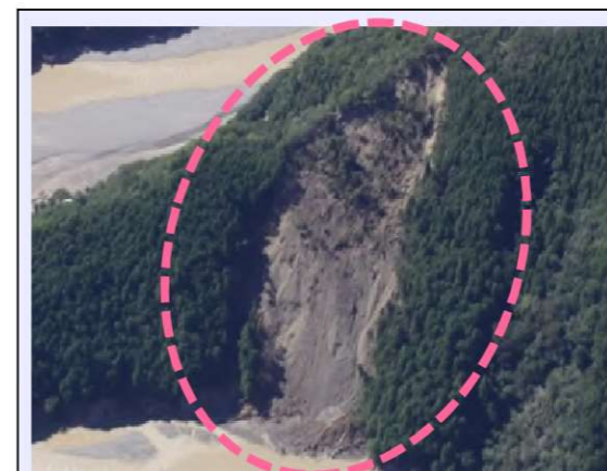
折立工区 (被災直後) ・崩壊規模 2.36ha ・対策：山腹工 (平成27年度工事完了・移管済)