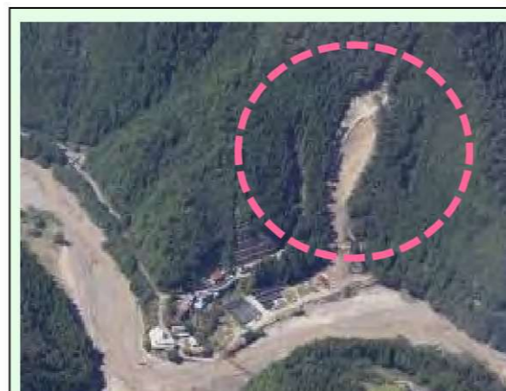
五百瀬工区(1号地) (被災直後) ・崩壊規模 0.47ha ・対策：山腹工 (令和4年度工事完了)