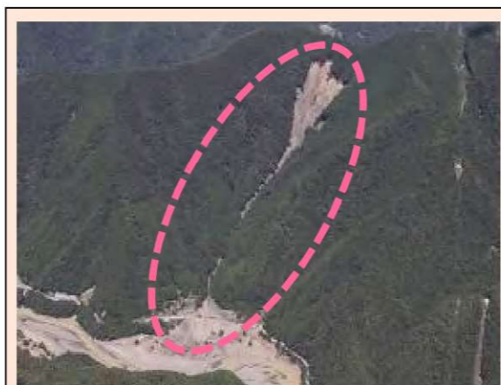
長殿(テラ谷)工区 (被災直後) ・崩壊規模 2.75ha ・対策：谷止工、山腹工