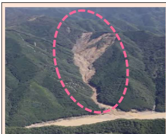
野尻工区 (被災直後) ・崩壊規模 20.44ha ・対策：谷止工、山腹工