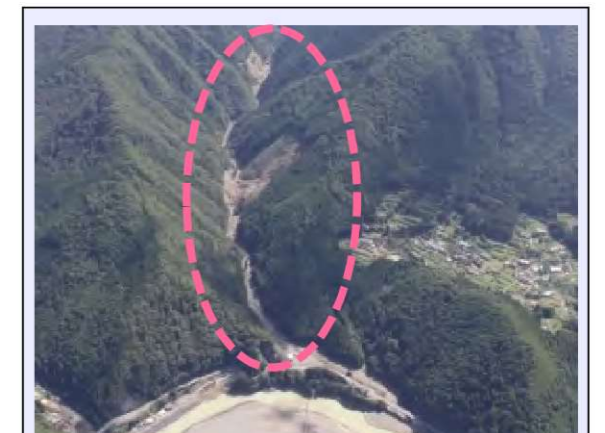
高津工区 (被災直後) ・崩壊規模 2.67ha ・対策：谷止工、山腹工 (平成30年度工事完了・移管済)