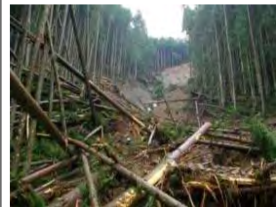
川合(深谷)工区 (被災直後) ・崩壊規模 0.54ha ・対策：山腹工 (平成25年度工事完了)