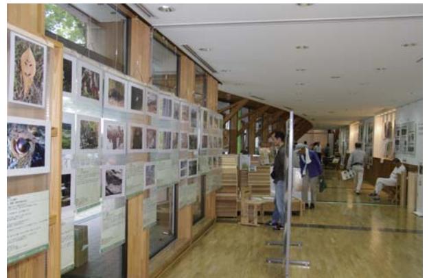
会場内には応募全作品を展示

また、会場の参加者から、「森林についてもっと知りたいと思った」「たまたま会場前を通りかかったら、ちょうど8才の男の子の発表の時。その子の自然への関心、感動に思わず足を止めて聞き入った」という声もありました。