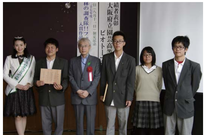
受賞された大阪府立園芸高校ビオトープ部の皆さん