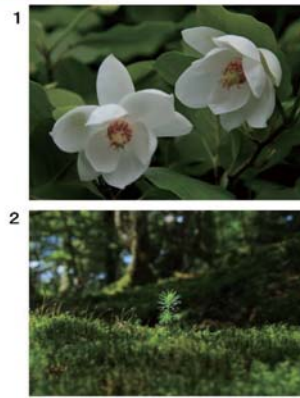
「健気に生きる」 川口 智史(奈良県橿原市)