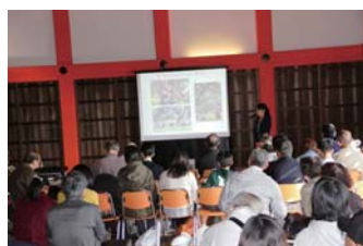
作品メッセージの発表