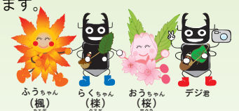
ふうちゃん(楓) らくちゃん(様) おうちん(桜) デジロ

林野庁 近畿中国森林管理局 箕面森林ふれあい推進センター TEL:06-6881-2013/FAX:06-6881-2055 〒530-0042 大阪市北区天満橋一丁目8-75 近畿中国森林管理局 3F URL: http://www.rinya.maff.go.jp/kinki/minoo_fc/