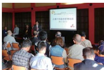
青木森林管理局長の挨拶