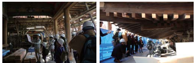
清水寺阿弥陀堂の修復工事現場を見学

応募者は、発表後の審査待ち時間に、清水寺と京都府教育庁文化財保護課の協力により清水寺阿弥陀堂の修復工事現場を見学させていただきました。建物を普段見られない角度から見る事ができ、数百年前に森から伐り出された木材が今も使われているなど、森林・木材と伝統的木造建築物の深い関係を知る貴重な体験ができました。