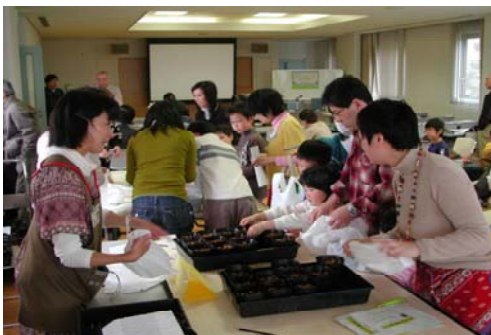
クヌギ、コナラの 苗木を手渡し

なお、西南図書館の玄関ホールにおいて4月から6月まで、「オオクワガタの棲める森づくり」の説明パネルを引き続き展示させていただきます、来館者に当取組を紹介しています。