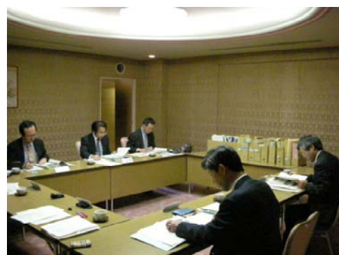
委員の方々と事例を選定

今後は第2回選定会議を開催し、各学年、各教科ごとにバランスがとれたものとなるよう絞り込みを行い、8月頃を目途に推奨事例集をまとめる予定です。