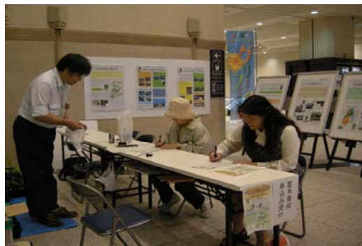
苗木育成の申し 込みに対応