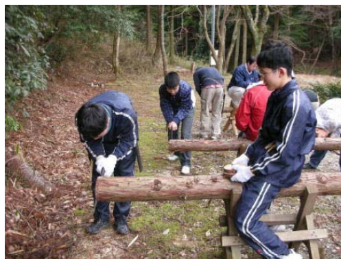
夢中で間伐木を 輪切り