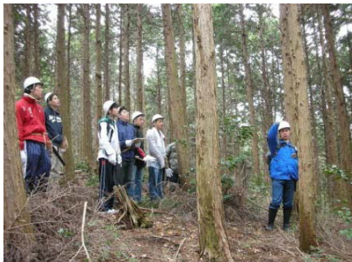
生徒とともに 間伐木を選定

間伐体験では、間伐の必要性を説明した後、現地にて実際に間伐木を選定し、間伐の実演を見学しました。その後、間伐木を林外に運び出し、輪切りの体験を行い、生徒からは「はじめ興味がなかったけどおもしろかった」、「かなり体力が必要でたいへんだった」、「森に来て空気の清らかさに驚いた」などの感想がありました。