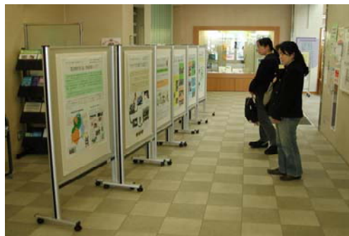
「オオクワガタの棲める 森づくり」のパネル を展示