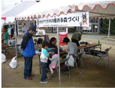
親子の申し込みに対応