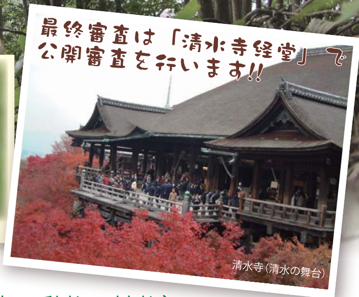
清水寺(清水の舞台)