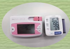
コンディション測定

森の中で本来の自分にもどってみませんか? 森のセラピーロードで「セラピーの様々なプログラム」を行うと心と身体がリラックスできます。森の癒しの効果が最大となるようにセラピーアシスターがご案内します。