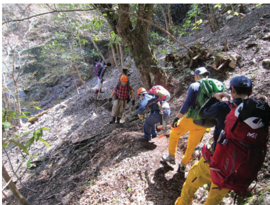
登山道整備の様子

今回、登山道を歩いて実感した美しい景観を全国に発信しながら、「美しい花には棘がある」ではないですが、 美しい景観を見るためには危険がある ということも同様に発信していかなければならないことも実感しました。多くの方が大杉谷を訪れ、安全に登山することを祈念して大杉谷を後にしました。