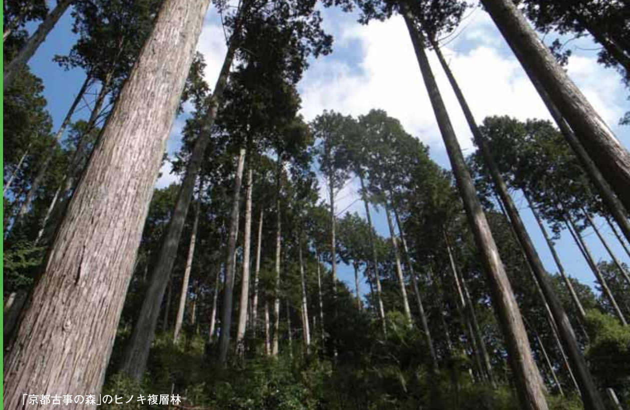
「京都古事の森」のヒノキ複層林