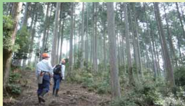
樹齢100年以上のヒノキから成る旧採種林

「京都古事の道」は、「京都古事の森」をめぐる40分程の探索路です。途中、ヒノキの大木の下に苗木を植栽した「複層林」や樹齢100年以上の大径木から成る「旧採種林」などを見学することができます。ご自由に探索をお楽しみ下さい。