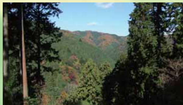
展望エリアからの眺め