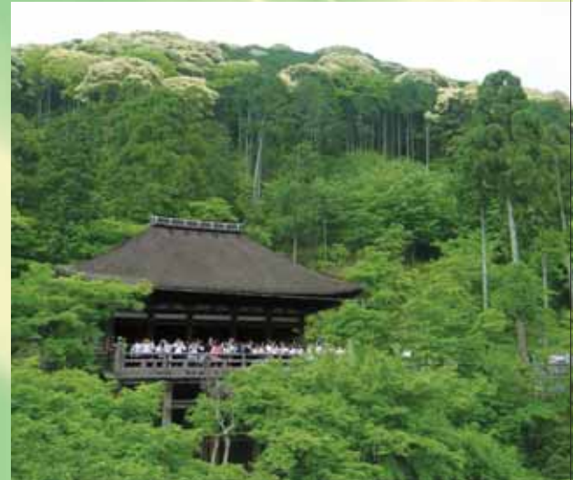
「清水の舞台」から見た高台寺山国有林(上方)