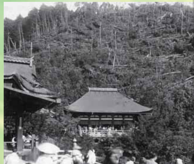
室戸台風直後の風倒木被害状況(上の写真と同じ箇所)