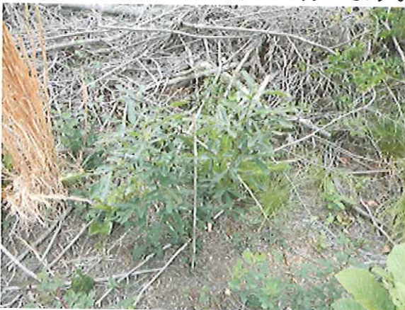
植えたクヌギの苗

目的 箕面国有林では、小学生などが森林・林業など体験を通じて学習できる場として「箕面体験学習の森」の整備を進めており、これまでに地域に自生する落葉広葉樹（クヌギ・コナラなど）の植栽を行ってきました。今年は小学生を対象に下刈りなどを体験することで森林・林業への理解を深めてもらうことを目的としています。イベントでは、木工・測樹体験も併せて行います。募集内容は別紙チラシのとおりです。