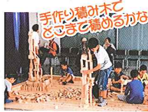
手作り積み木で どこまで積めるかな?