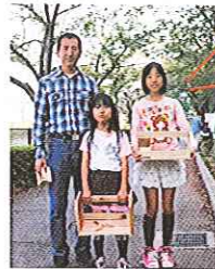
こんな作品 できました!