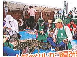
人気のツルカゴ編み教室