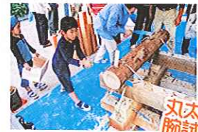
丸太切りと 腕試し