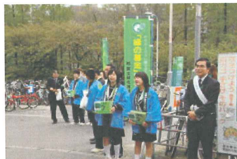
平成20年度街頭募金風景

近畿中国森林管理局では、近年高まりつつある国民の森林への関心と理解をさらに深め、森林づくりへの参加に結びつけるさまざまな取り組みを行っています。