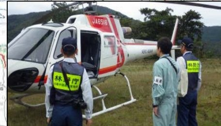
ヘリコプター搭乗状況 (林野庁、鳥取県職員)