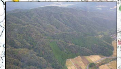
鳥取県東伯郡三朝町(民有林)