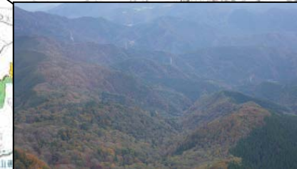
鳥取県鳥取市(国有林)