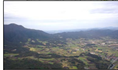
岡山県真庭市(民有林)