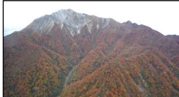
鳥取県西伯郡大山町 (国有林)