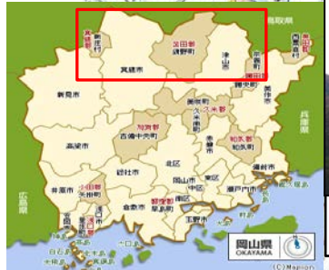
岡山県真庭市 (国有林)