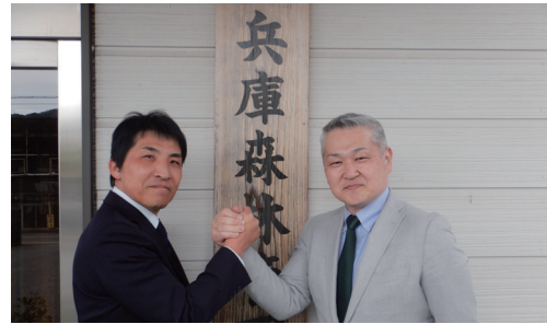
徳田次長（左）と固い握手の山下署長