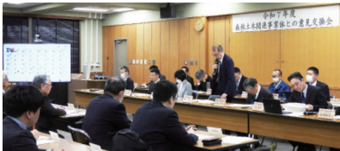
Web会議システムを併用する形の会場の様子

意見交換会では、当局からの事業の発注見通し、ICT技術の活用事例、国有林の位置をwebで確認できる国有林ビューア、林野火災予防に係る注意喚起等の情報提供を行いました。また、事業者の皆様からは日頃の事業実行に当たっての疑問点等に関するご意見やご要望をいただき、当局が円滑な事業を推進していくうえで貴重な情報を得ることができ、有意義な意見交換を行うことができました。