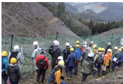
現地検討会開会の様子

令和8年3月4日(水)、広島市安芸北区的押手山国 おしてやま 有林において、シカ被害対策をテーマとして現地検討会を開催しました。