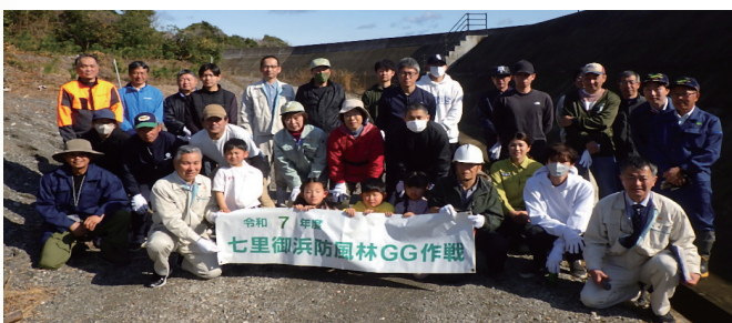
御浜町会場の集合写真

三重森林管理署では、地域の皆様の思いが込められた苗木が立派なクロマツになり、未来の世代へその思いが繋がっていきけるようにこれからも大切に育ててまいります。