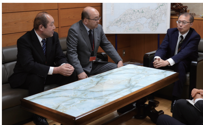
授与式の後、局長室で歓談の様子

また、認定者の皆様からは、認定を受けたことを励みに、引き続き地域の安全・安心に貢献できるよう励んでいきたいとお言葉をいただきました。