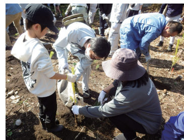
紀宝町会場の植栽の様子

令和8年2月28日(土)、「七里御浜 しちりみはま 松林を守る協議会」により七里御浜 しちりみはま 国有林内の3会場（熊野市会場、御浜町会場及び紀宝町会場）で「令和7年度七里御浜防風林GG作戦」が開催されました。本イベントは、平成5年度から地域住民参加形式で「松くい虫抵抗性クロマツ」苗木の植樹や防風林周辺の清掃活動を行っており、今回で29回目の開催となりました。