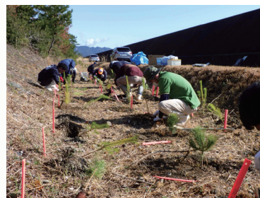
熊野市会場の植栽の様子

当日は快晴のなか、3会場合わせて約130名の地域の方々に参加いただき、各会場80本ずつ計240本の「松