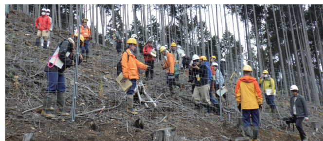
設置した林業用の鋼製防護柵を見学する様子

これに対して、鋼製ネットを使用した防護柵は耐久性が高く、10年以上にわたって被害を防ぐことが可能であると考えられますが、広島県内では農地にしか設置実績がありませんでした。そのため、広島森林管理署では県内で初めてとなる林業用の鋼製防護柵を令和7年度に設置し、剥皮被害に対する有効性について検証を進めてまいります。