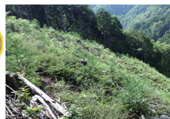
花粉の少ない苗木への植替え (三重県いなべ市：悟入谷国有林)