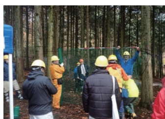
アニマルネットの設置実演 みのお (大阪府箕面市：箕面国有林)

国有林のフィールド・技術・組織を活かし、現地検討会や局で開催する研修への受け入れ等を通じて、民有林関係者への技術的支援、人材育成への支援を行います。