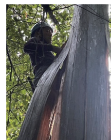
もとかわし 原皮師による檜皮採取 (京都府京都市：鞍馬山国有林)

また、民有林からの供給が期待しにくい林産物である檜皮 ひわだ の供給にも引き続き取り組みます。