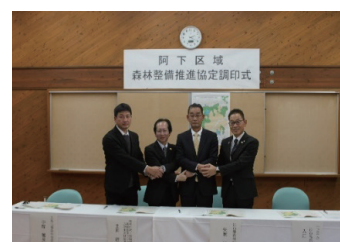
阿下区域森林整備推進協定の調印式 (令和7年12月)

また、森林経営管理法の改正を踏まえて、市町村等からのニーズに応じた地域における集約化の取組への支援を行います。