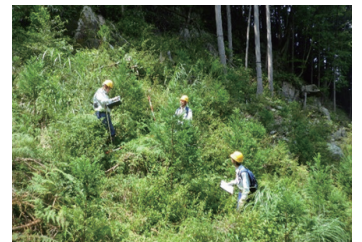
植栽6年後の様子（無下刈） （岡山県津山市：黒木国有林）

また、造林作業の一層の低コスト化・省力化を目指し、引き続き、現場実証に取り組みます。