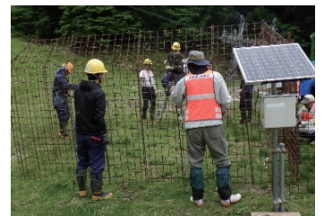
米原市との協定に基づく ICT 罠いわなの設置状況

また、市町村等と協定を締結し、国有林内でシカ捕獲を行うための罠の貸出し等の捕獲協力に引き続き取り組みます。