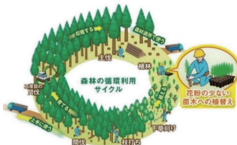
花粉発生源対策のイメージ