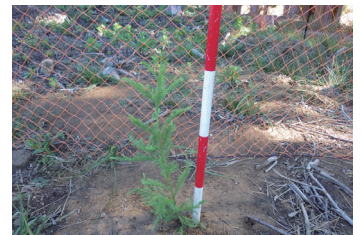
特定苗木の植栽状況 （三重県いなべ市：悟入谷国有林）