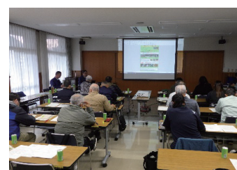
ノウサギの被害対策の出張講義 (岡山県真庭市)