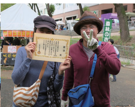
丸太切りピットリ賞 1