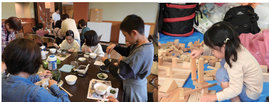
和歌山森林管理署（苔テラリウム作り）

キャラクターたちは、来場者に手を振ったり、子どもたちと触れ合ったりと、会場の盛り上げ役として大活躍。森林の市ならではの温かい交流が生まれ大盛況となりました。