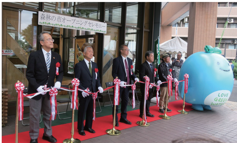
オープニングセレモニー

令和7年10月26日（日）、大阪市北区の毛馬桜之宮公園および桜ノ宮合同庁舎において、「水都おおさか森林（もり）の市 2025」を開催しました。秋の深まりを感じる季節の中、森林の恵みや木の魅力にふれられる本イベントには、地域内外から多くの方が来場され、にぎやかな一日となりました。