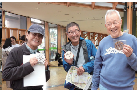
クイズラリー・アンケート

る姿がとても印象的でした。また、会場内で実施したクイズラリーには長い行列ができ、先着500名の木製品プレゼントを手にした参加者からは笑顔がこぼれました。