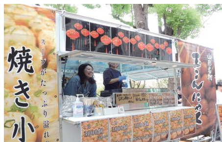
バイオカーボンになわ