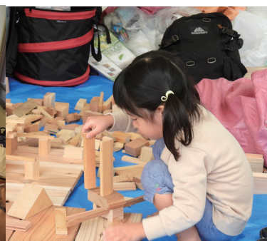
京都・森と住まい百年の会