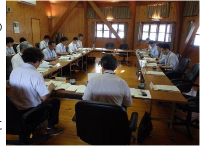
(広島県との地域林政連絡会議の様子)