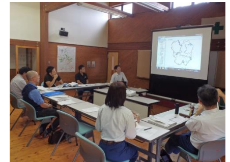
（ゾーニング設定の様子）