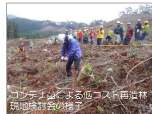
コンテナ苗による低コスト再造林現地検討会の様子