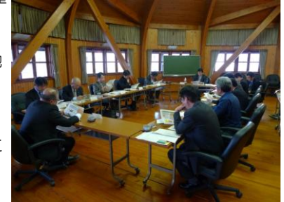
（広島県との地域林政連絡会議の様子）