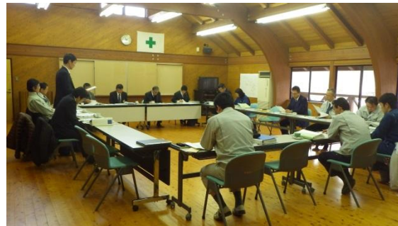
（計画案の地元関係者への合意形成の様子）