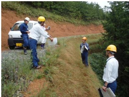
（開設した林業専用道視察の様子）