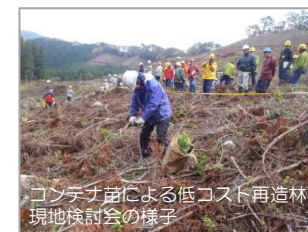
コンテナ苗による低コスト再造林現地検討会の様子