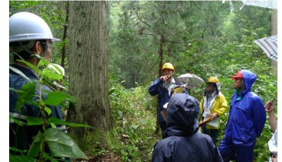
（複層林施業を説明する様子）