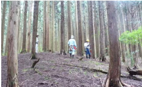
（現地踏査により路線を選定する様子）

・ 地元自治体への情報提供により、今後、民国連携に向けた取組の浸透及び波及効果が期待。