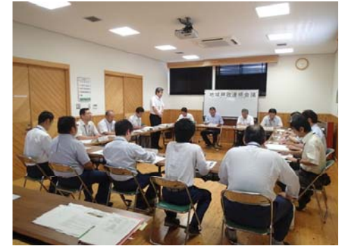
（岡山県との地域林政連絡会議の様子）