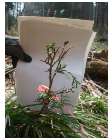
（二ホンシカの食害の様子）