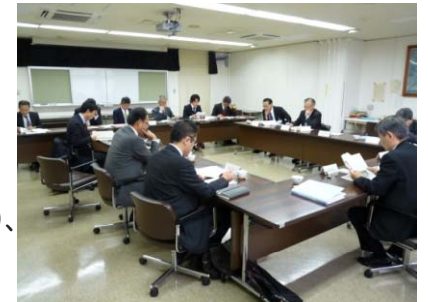
（バイオマス産業都市構想策定委員会の様子）

・ 国有林は津山市の森林の10%を占めており、「津山市バイオマス産業都市構想策定委員会」、「津山市森づくり委員会」において、関係機関との連携により津山市の地域林業の活性化に寄与。