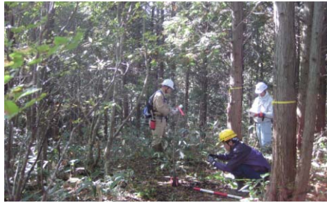
（民有林関係者と連携した現地踏査の様子）

・ 山ノ神谷・深谷地域において、国有林が先行して林業専用道等の基盤整備を実施。今後、奥地の民有林において路網整備が図られ、民有林における森林整備の推進及び木材の安定供給等に寄与。