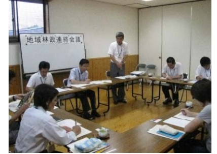
（鏡野町との地域林政連絡会議の様子）

・ 各市町村の意向確認に基づき、新たな協定を順次締結予定。併用協定の見直し、更新により、各市町村において各路線の現状認識及び自主的な維持管理の促進に寄与。