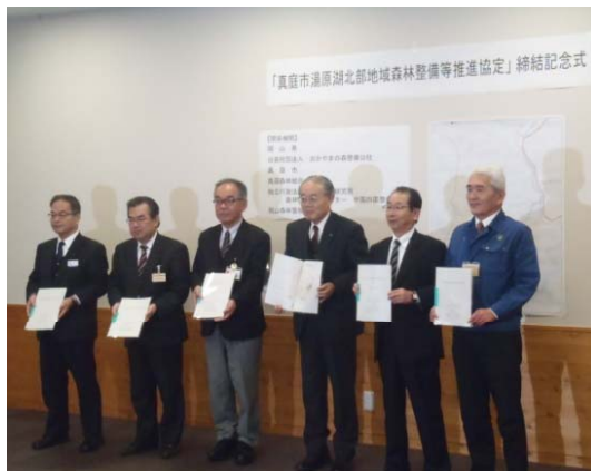
締結記念式の様子