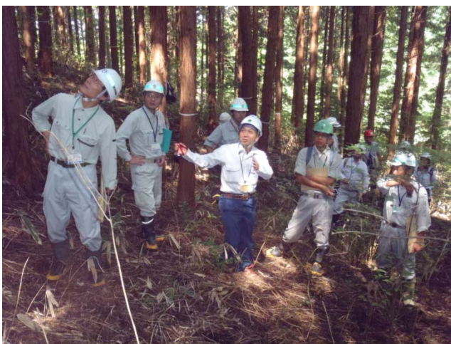
列状間伐推進のための現地検討会の様子