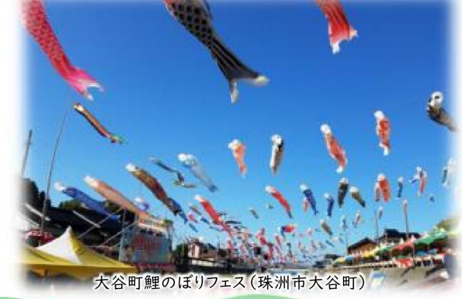
大谷町鯉のぼりフェス(珠州市大谷町)