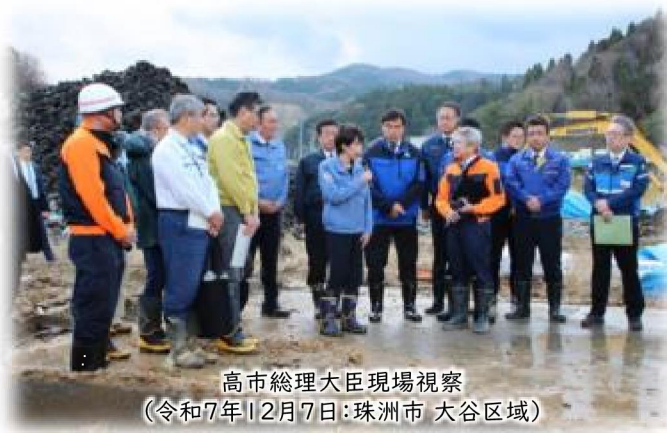
高市総理大臣現場視察 (令和7年12月7日:珠州市 大谷区域)