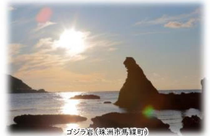
ゴジラ岩(珠州市馬縹町)