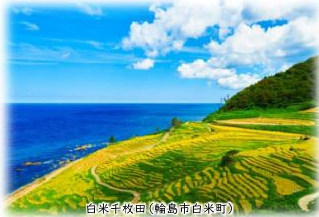
白米千枚田(輪島市白米町)