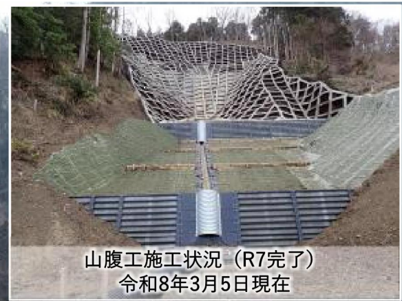
山腹工施工状況(R7完了) 令和8年3月5日現在