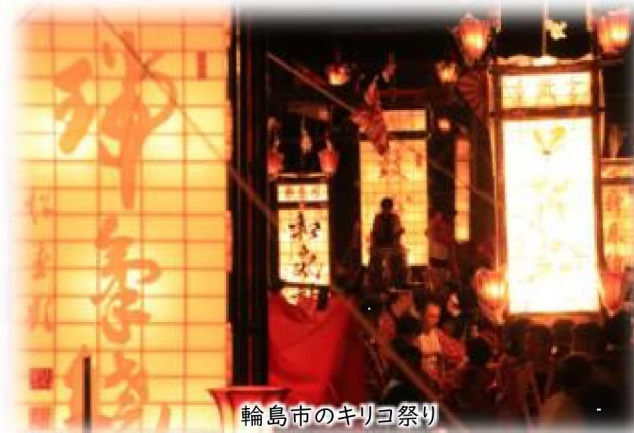
輪島市のキリヨ祭り