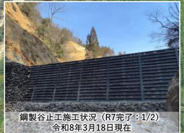
鋼製谷止工施工状況 (R7完了: 1/2) 令和8年3月18日現在