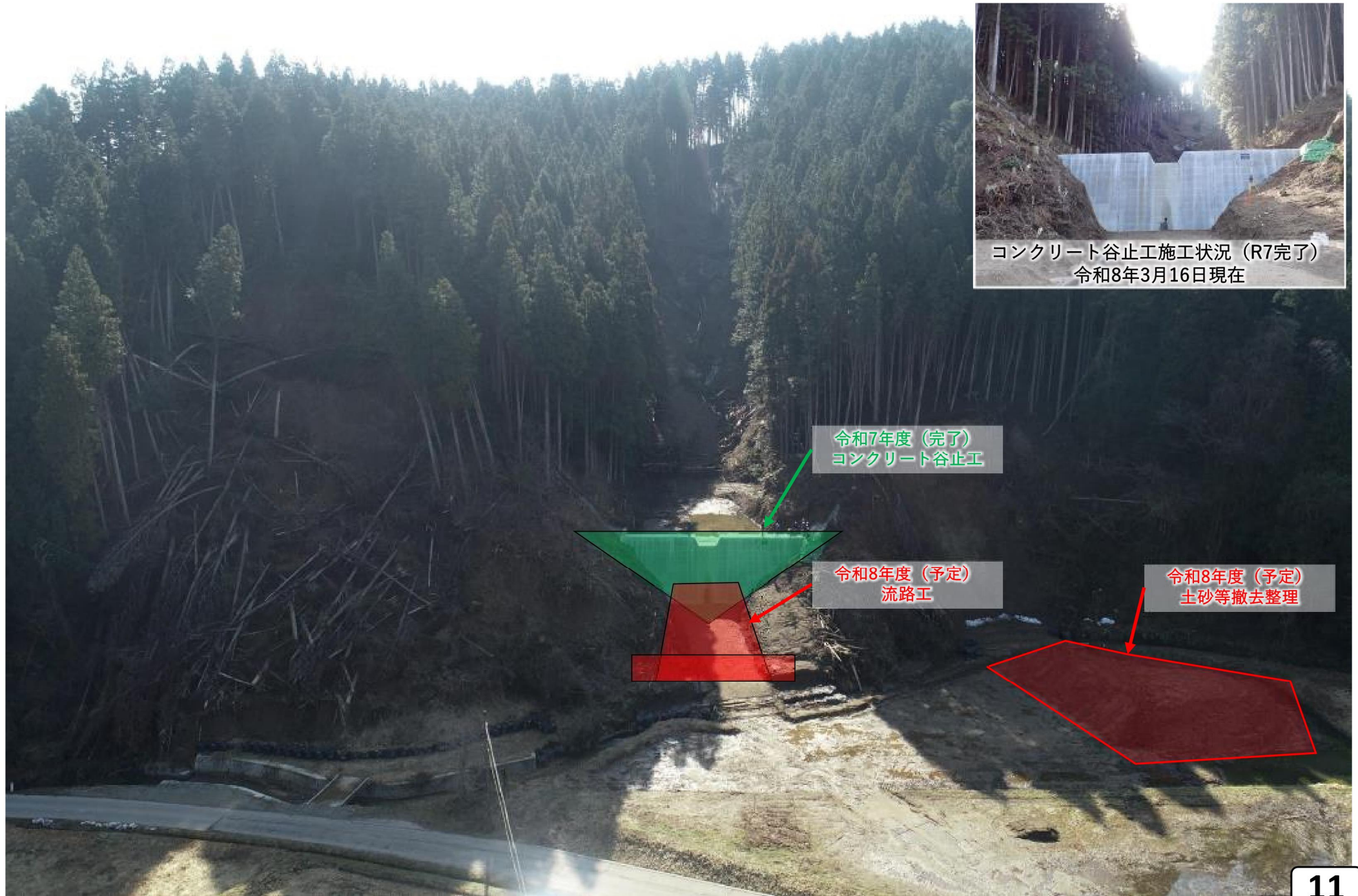
コンクリート谷止工施工状況 (R7完了) 令和8年3月16日現在