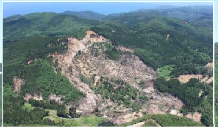
約42haの大規模崩壊地 令和6年5月29日現在