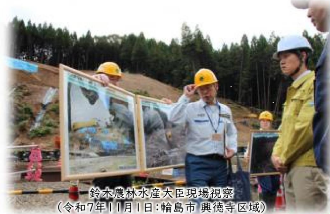
鈴木農林水産大臣現場視察 (令和7年11月1日:輪島市 興徳寺区域)