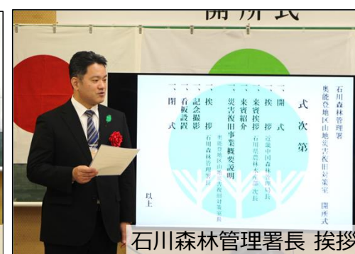
石川森林管理署長 挨拶