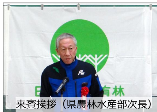
来賓挨拶 (県農林水産部次長)