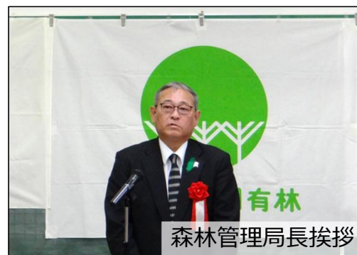
森林管理局長挨拶