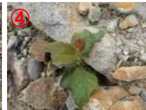
④地点 (草本類)・フキ・ヨモギ・イタドリ (木本類)・ヤナギ