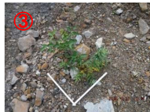
③地点 (木本類)・ヤナギ