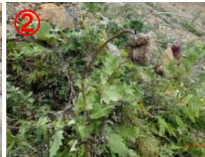
②地点 (草本類)・フキ・フジアザミ