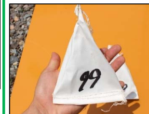
水溶性容器イメージ