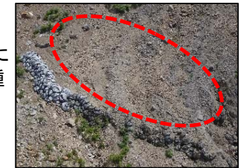
施工箇所(袋型石詰土留工の上部)