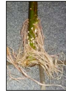
発根したヤナギ枝のイメージ