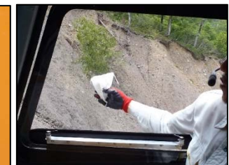
ヘリによる散布イメージ