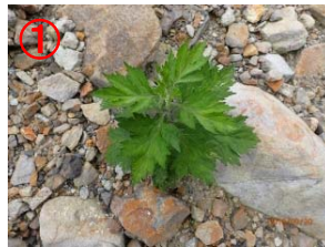
①地点 (草本類)・フキ・ヨモギ・ススキ等 (木本類)・ヤナギ