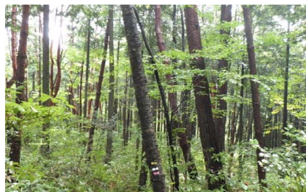
林内の状況(アカマツ人工林)