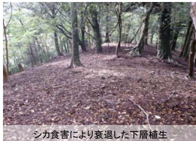
シカ食害により衰退した下層植生