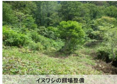
イヌワシの餌場整備