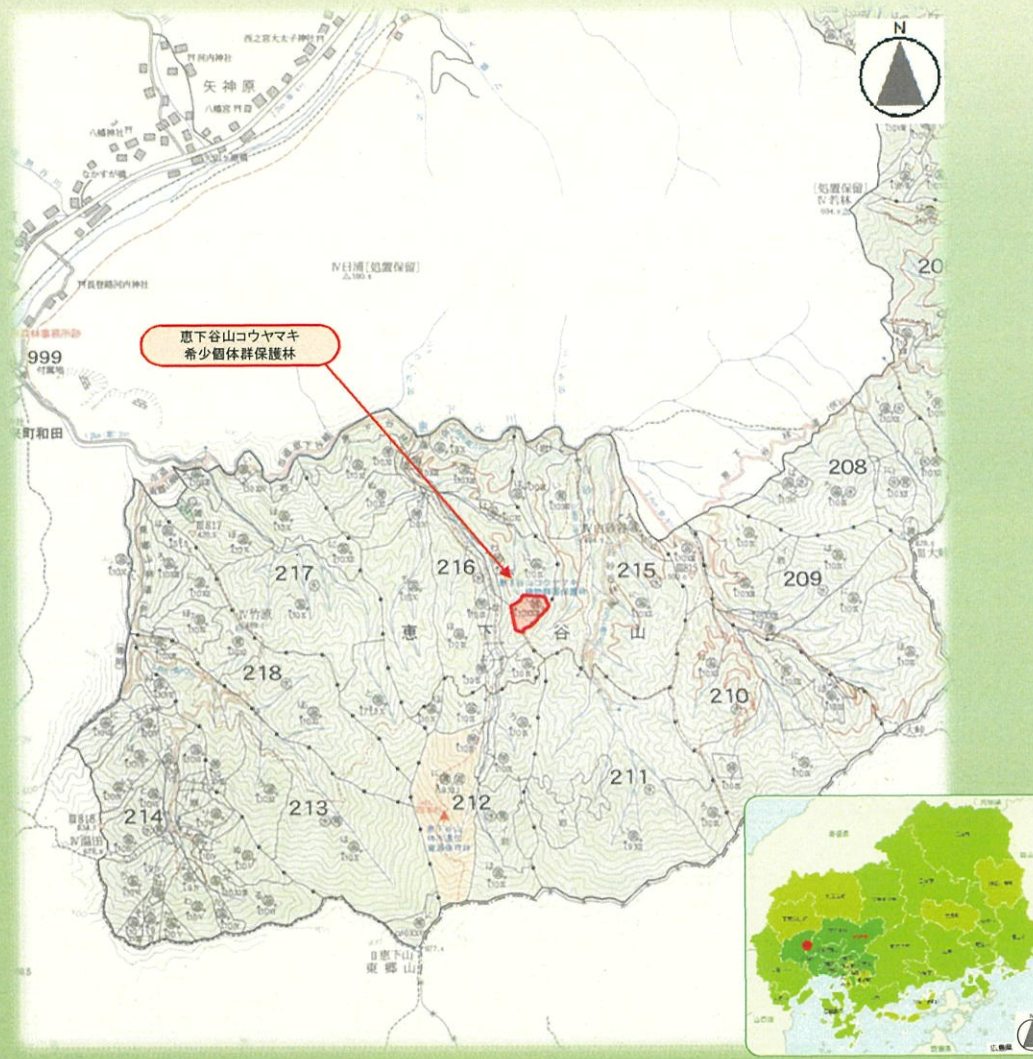
恵下谷山コウヤマキ希少個体群保護林 位置図