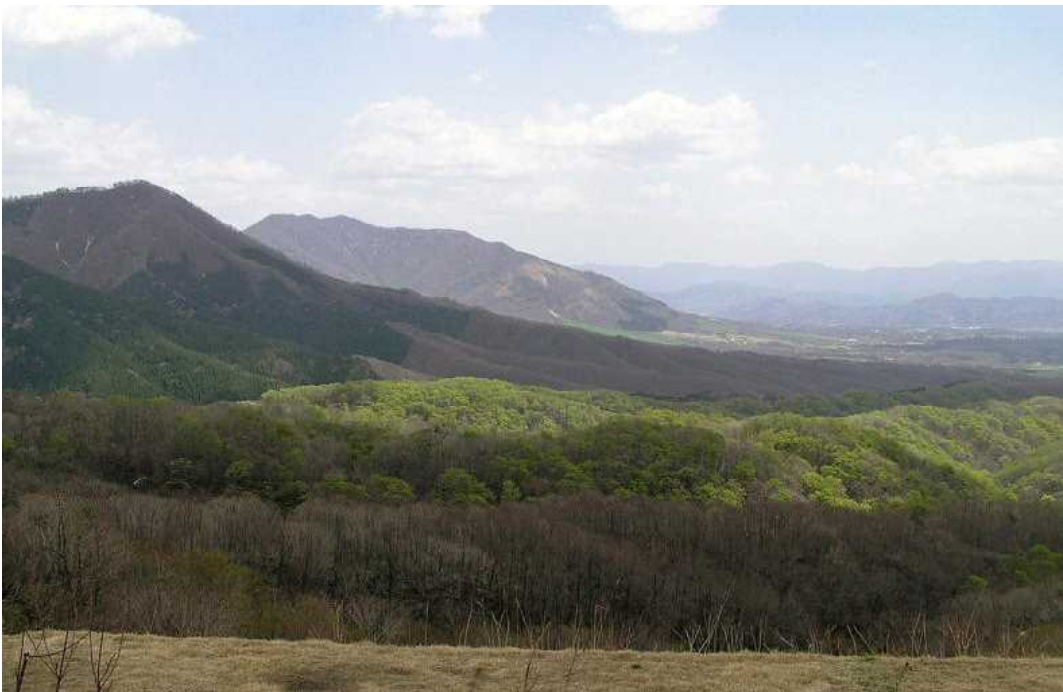
旭川森林計画区：蒜山高原風景林（上蒜山国有林）