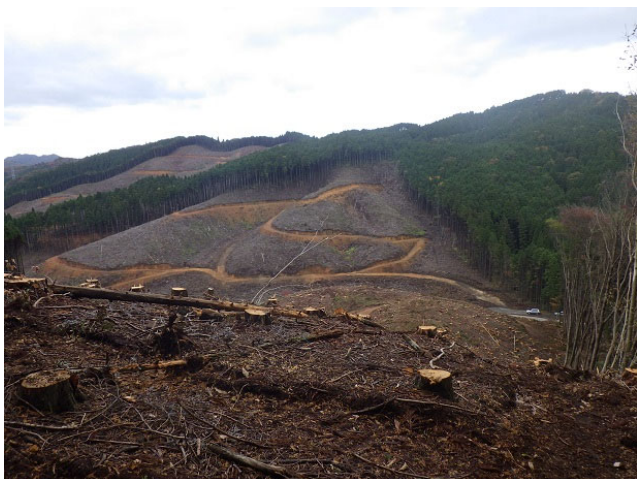
主伐箇所と路網の整備状況（河原山国有林）