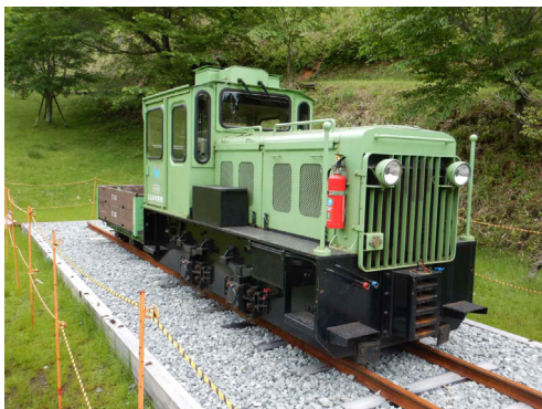
宿泊施設に隣接して設置された機関車