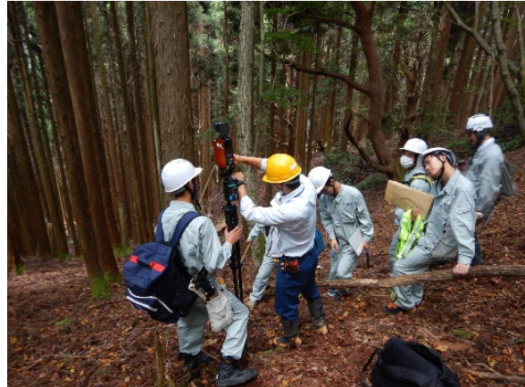
森林大学校（OWLによる収穫調査実習 大学校演習林）