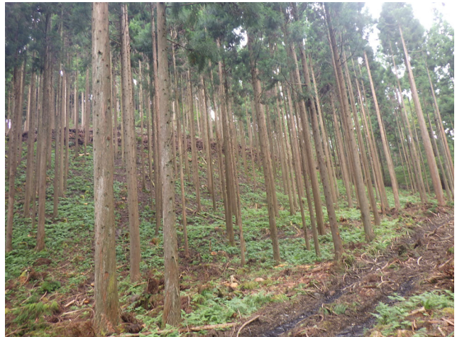
間伐後の林内の様子（本谷国有林）