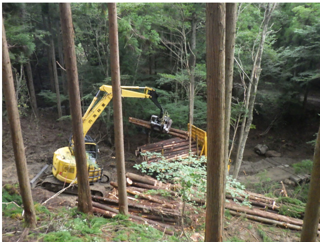
林業機械による集造材作業（三室国有林）

また、森林整備にあたっては、少花粉スギのコンテナ苗の使用と併せ、一環作業システムの推進や成長に優れた苗木の活用、植栽本数の低減、下刈りの見直し等、低コスト造林に資する取組に積極的に取り組み、併せて効率的な施業の実施に必要な路網の整備を推進します。