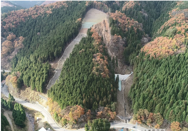
令和3年度山腹工（戸倉東山国有林）

地域の安全・安心を確保するため、関係機関とも連携を図りつつ、引き続き平成30年7月豪雨による被害箇所を中心とした被災山地の復旧治山対策を計画的に推進実行します。