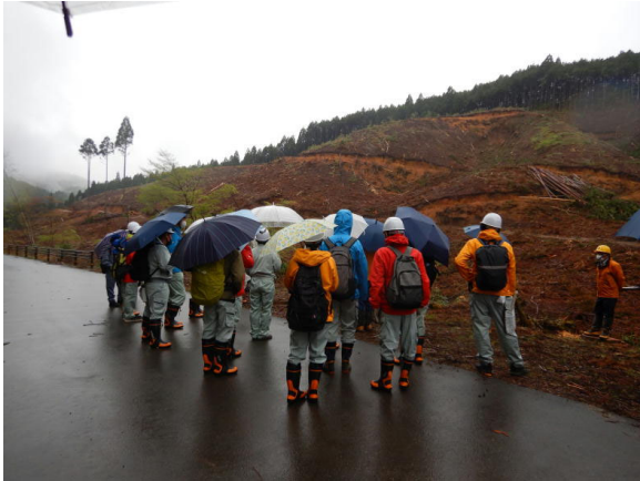
森林大学校（生産現場の見学 河原山国有林）

また、宍粟市と連携しつつ、兵庫県立森林大学校への実習フィールドの提供や、職員の講師派遣等を通じて、減少する地域における林業従事者の人材育成等に協力するなど、民国連携の取組を推進します。