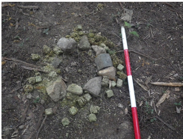
小林式誘引捕獲法設置状況（郷の谷国有林）

シカ等有害鳥獣駆除については、関係市町と協定を締結するなど、関係機関と連携して取り組みます。また新たな捕獲方法である小林式誘引捕獲法を現地検討会等で広く周知するとともに、国有林においても小林式誘引捕獲法等を活用し、委託によりシカの有害捕獲に取り組みます。