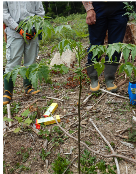
センダンの芽かき作業（札楽山国有林）