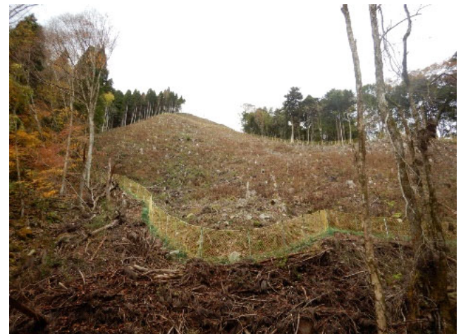
シカ防護柵の設置状況（河原山国有林）