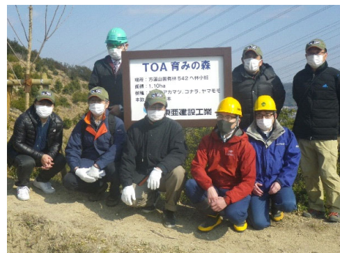
企業による森林整備（方蓮山国有林）