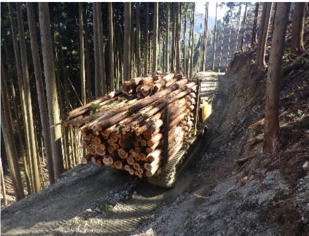
路網の整備と木材の搬出作業（本谷国有林）

林産物の安定的な供給への取組として、必要な路網の整備を含めた林業の低コスト化を推進しつつ、間伐等の森林整備を効率的に行い、発生した間伐材等の持続的かつ計画的な供給に務め、地域における林業の成長産業化に向けて貢献していきます。