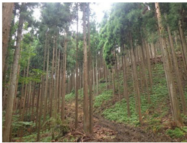
列状間伐の実施状況（河原山国有林）