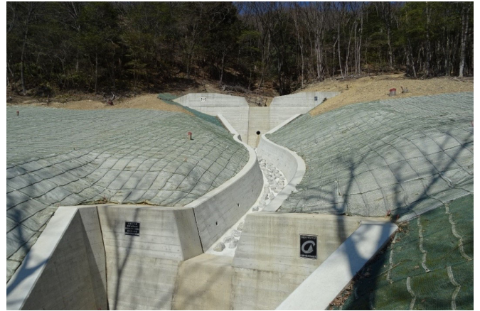
令和3年度溪間工（書写山国有林）