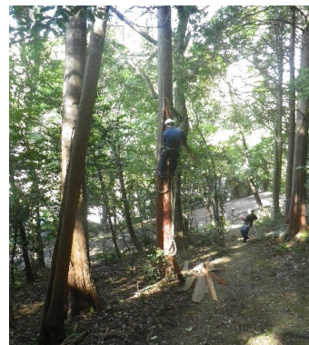
檜皮土による檜皮採取（増位山国有林）