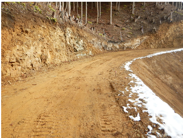
林業専用道の新設状況（阿舎利林業専用道）