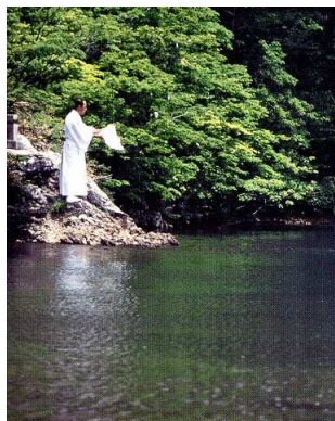
山開きに行われる神事

夜叉ヶ池はこれまで水が涸れたことが無く、昔から雨乞いの池として敬われてきました。また、激しい雨風や深い霧に包まれることも多く、その神秘性から数々の伝説や謎に彩られています。いずれの伝承も「干ばつ時に雨を降らせる交換条件として長者の娘が大蛇に嫁ぐ」というあらすじが基本となっています。