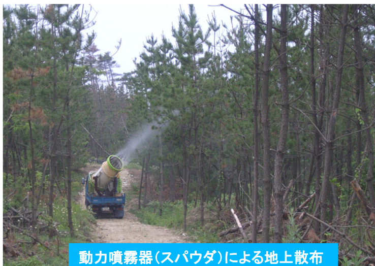
動力噴霧器(スパウダ)による地上散布

連絡先・・・福井森林管理署業務グループ(☎050-3160-6105) 住所：福井市春山1-1-54