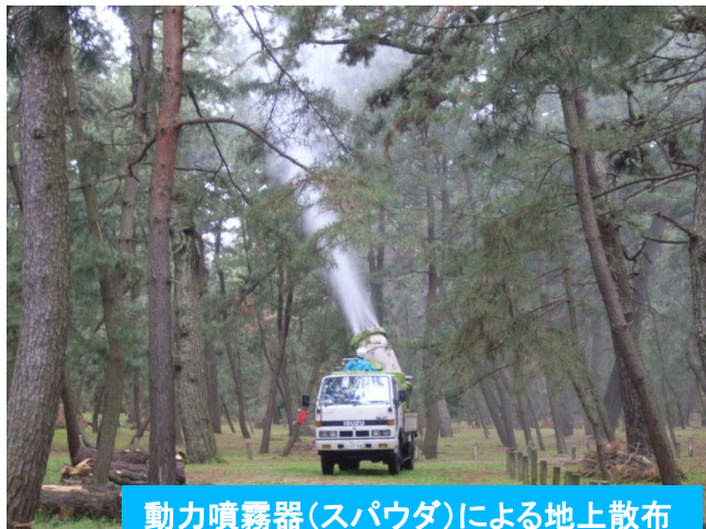
動力噴霧器(スパウダ)による地上散布