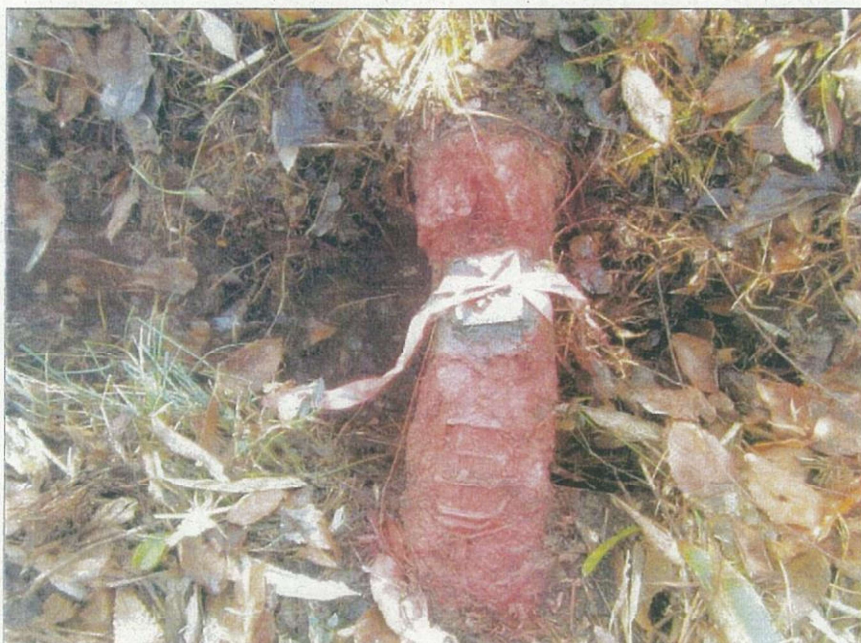
写真番号：6 標識番号：187 状態：番号脱落