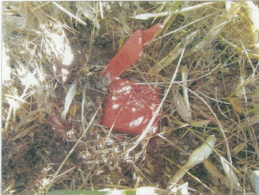
写真番号：4 標識番号：176 状態：埋没