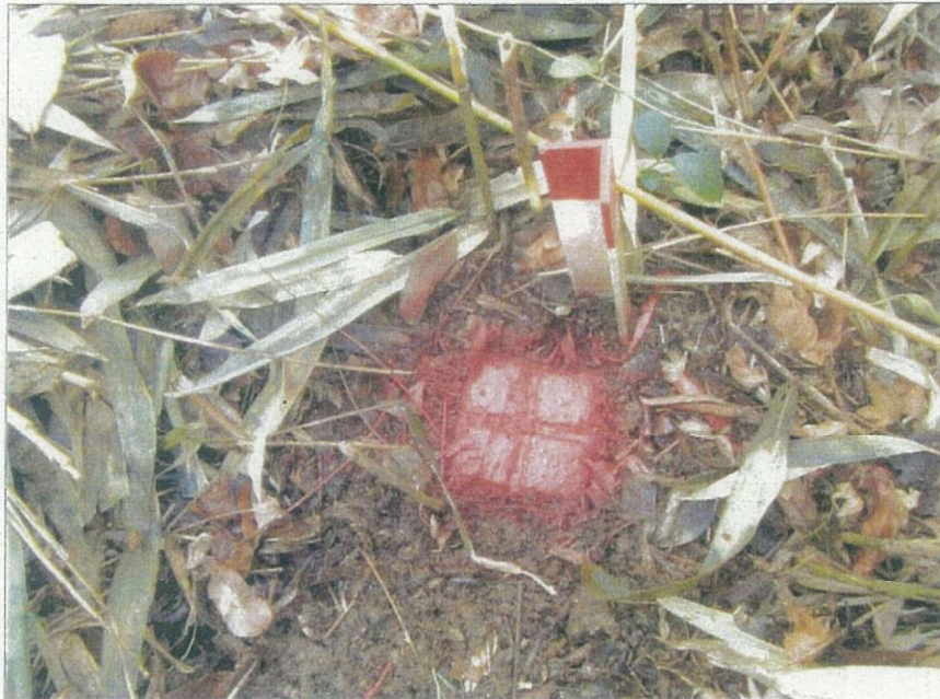
写真番号：5 標識番号：181 状態：埋没