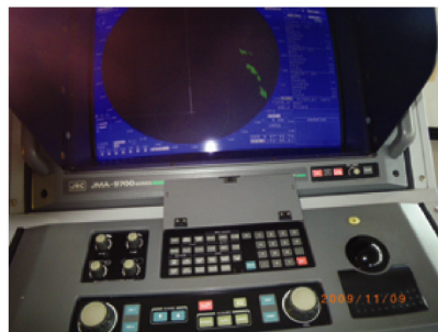
おがさわら丸内の操舵室(レーダーに聶島列島が見えている)