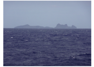
聶島列島付近、あと2時間で父島到着