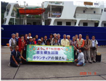
母島到着=竹芝を出て29時間