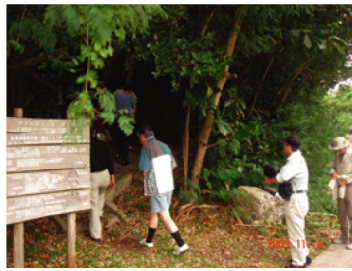
「静沢の森」遊歩道の散策