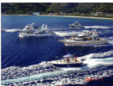
父島を後に「おがさわら丸」で東京へ。島民が船で見送り。