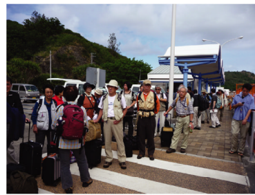
父島(ゆり丸乗船前)