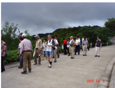
夕陽の絶景ポイント