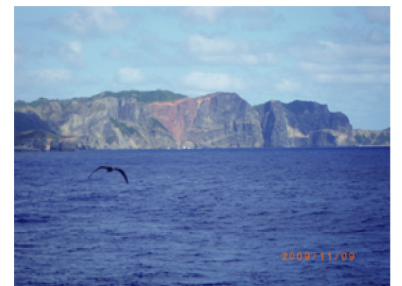
父島「ハートロック」(ゆり丸より)