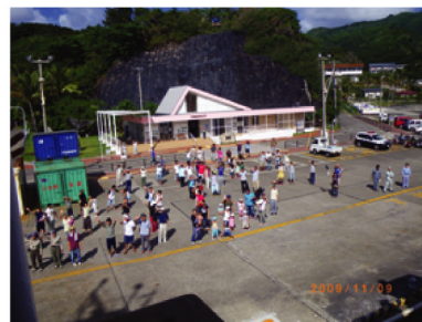
母島の皆さん、お世話になりました