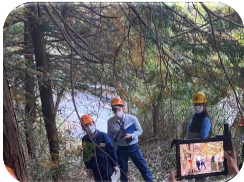
タブレット端末による境界標AR確認