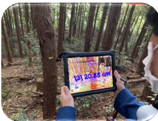
タブレット端末による 胸高直径計測