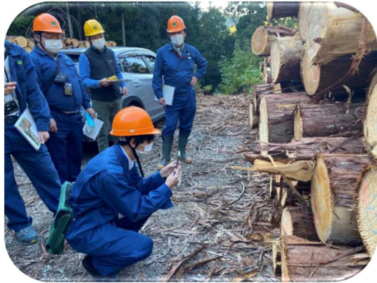
タブレット端末による検知