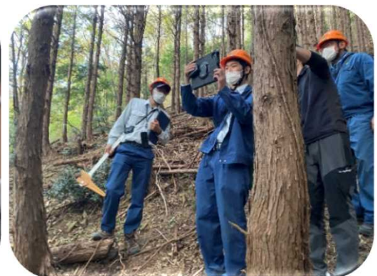
タブレット端末による 樹高測定