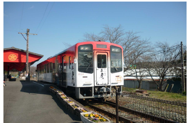
天浜線(ラッピング列車)気賀駅にて

もあることから、平成29年度は「ストックヤード(中間土場)」の作設を計画し、少しでも有利な生産販売になるよう取り組んでいます。