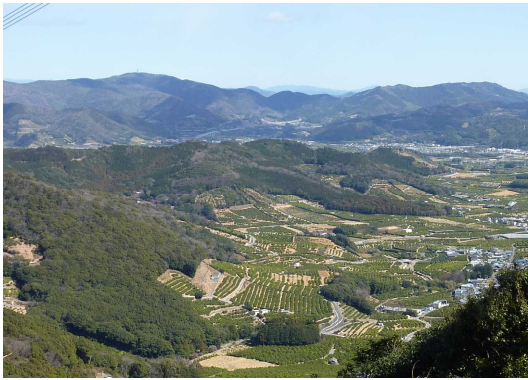
国有林からみかん畑を望む

三ヶ日と言えば、みかんが有名です。江戸時代中頃、紀州那智地方から「紀州みかん」の苗木を持ち帰ったのが始まりで、その後、天保年間に、実の大きい「温州みかん」を三