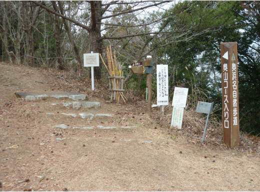
枝奥浜名自然休養林(富幕山入口)

また、管内の国有林は、林道路網が発達しており、22路線、総延長81kmと1日では全線を回ることができるが難しい距離ですが、日頃から、巡視・点検を行い、異常があればチャーター等により復旧しています。一方、国有林手前の民有地の道路が狭いなど、素材搬出用の大型車が入れない地域