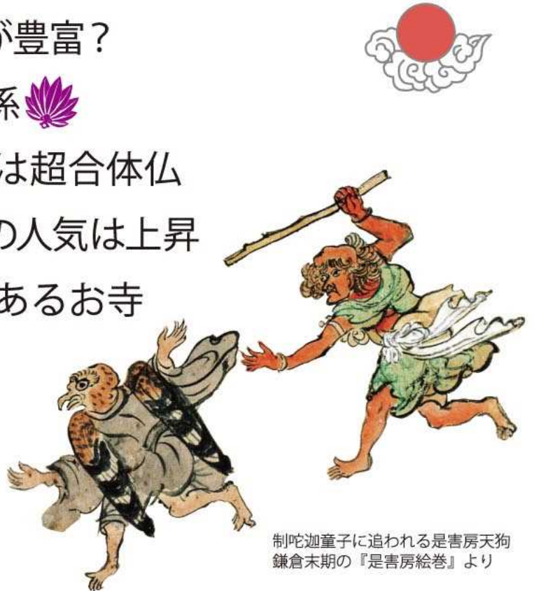
制陀迦童子に追われる是害房天狗 鎌倉末期の『是害房絵巻』より